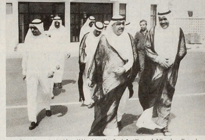
وزير العمل والشؤون الاجتماعية والإسكان أثناء مغادرته أمس الدوحة إلى جنيف