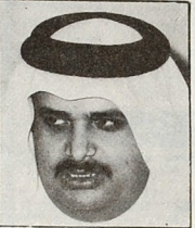
سعادة الشيخ حمد بن جاسم آل ثاني التفويض لليونسكو سوف يبحث خلال هذه الدورة طلبا تقدمت به دولة الكويت

تدعو في اليونسكو لبحث الأوضاع المساوية للمؤسسات التعليمية والثقافية في الكويت في اجتماعات المجلس التنفيذي لليونسكو والتي ستعقد في الكويت في الفترة من ١٤ إلى ١٦ من الشهر الجاري. ويشارك في الاجتماعات ممثلون من قطر والكويت والبحرين والعمان والقطر العربي واليمن والجزيرة العربية واليمن والكويت والبحرين والعمان والقطر العربي واليمن والجزيرة العربية.