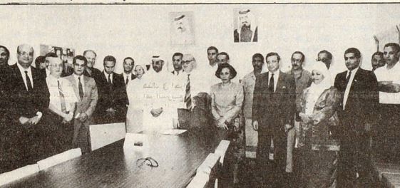
ابناء الجالية المصرية مع السفير في بدء حملة التبرع بالدم