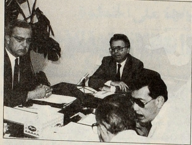
في المؤتمر الصحفي حول كلية التكنولوجيا

بالخير جلسة يوم السبت الموافق ١٩٩٠/١١/١٠ الساعة الثامنة صباحا بمحكمة المدعى عليه الكائن شارع محمد العارضة بالرفقة خلف عمارة شركة كطلان بين الدوحة وفي حاله خلتكم عن الضرر بعد ذلك من حضر في قاعات المارة (٥٥) من كاتبة المرافعة المدنية والجزائية المحكمة المدنية الصغرى