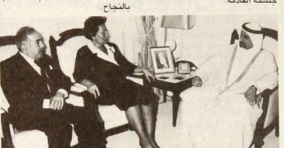
وزير التربية والتعليم مع عميدة كلية الآداب بتركيا

برئاسة سعاده السيد عبد العزيز بن خالد العاللي رئيس المجلس بقره بالقر الأبيض استعرض المجلس مشروع قانون بتعديل المادة ٥٠ من القانون رقم ٤٠ لسنة ١٩٧٨ في شأن الرقابة على المعادن الثمينة وخصها ودمغها كما استعرض مشروع قانون بشأن قواعد الاستعانة من الاعفاء من الرسوم الجمركية للمنتجات الصناعية ذات