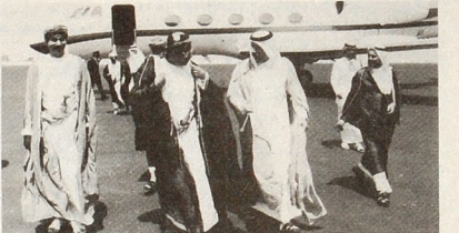
وزير الاقتصاد العملي عند وصوله الى مطار الدوحة

اجتمع سعاده الشيخ حمد بن جاسم بن حمد آل ثاني وزير الاقتصاد والتجارة صباح امس مع سعاده السفير الكوري السيد يونج يو سفير جمهورية كوريا لدى الدولة. وتم خلال الاجتماع بحث سبل دعم وتعزيز العلاقات الثنائية بين البلدين وخاصة في المجالات التجارية والاقتصادية.