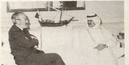
وزير الاعلام والثقافة مع السيد ادجار بيتراني

الدوحة - في ١٠ وصل آل ثاني وزير التجارة والصناعة سعاده السيد سالم بن عماد العزالي وزير التجارة والصناعة بسفلة عمان في زيارة للدارا شترقق يومين. وكان في استقباله لدى وصوله مطار الدوحة الولو سعاده الشيخ حمد بن