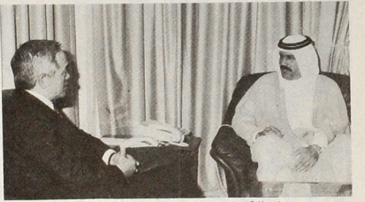
وزير الاقتصاد مع السفير الكوري

صغاء - في ١٠ وصل آل ثاني عز عزص امس سعاده الشيخ محمد بن حمد آل ثاني والوفد المرافق له ضمن زيارته الحاسية لجمهورية العربية اليمنية وكان استقباله بمظهر استياد السيد محسن اليوسفي محافظ تغر وجبار السنولاني بالمحافظة. وكان سعاده ق قام صباح امس بزيارة لمحافظة مارب حيث اطلع على