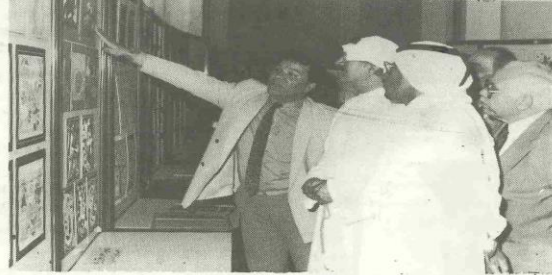
الدكتور مدير الجامعة بالانابة يتابع باهتمام انتاج اطفال المرحلة الابتدائية في المعرض .

وبعد فان المعرض الحالي الذي اقامه قسم المناهج وطرق التدريس بكلية التربية والذي يعد المعرض الاول لتخصص التربية الفنية لهو نموذج يحتذى في التنسيق والاعداد والعرض ، ويؤكد على ضرورة اهمية التربية الفنية كعلاج مرض وجداني مطلوب لكل الاطفال صفرا وكبارا سواء في التعليم النظامي او التعليم غير النظامي . فان بناء لا يستقيم في جوانب ؟ - سامته المتعددة والتميزه كل حسب تخصصها .