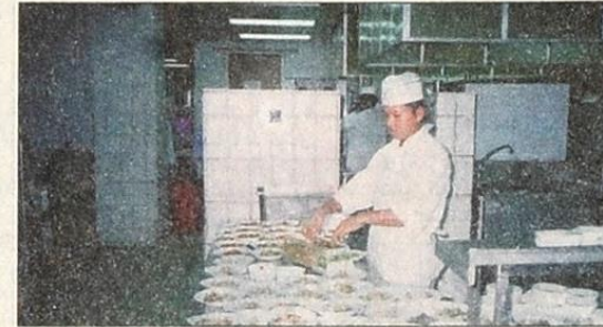
أحد العمال في مطبخ الكافتيريا يغلف الوجبات

أن هناك تنسيقاً في هذا الخصوص مع مشرفي الجامعة.