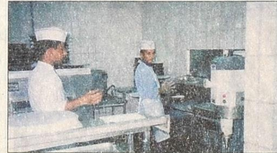
الطباخون والتدفيين في نظافة المطبخ