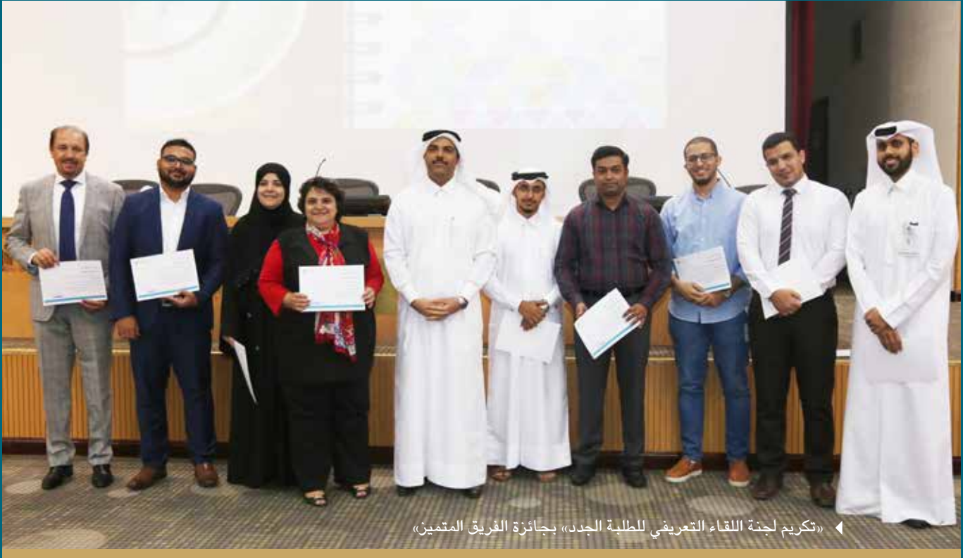
◀ «تكریم لجنة اللقاء التعريفي للطلبة الجدد» بجائزة الفريق المتميز»