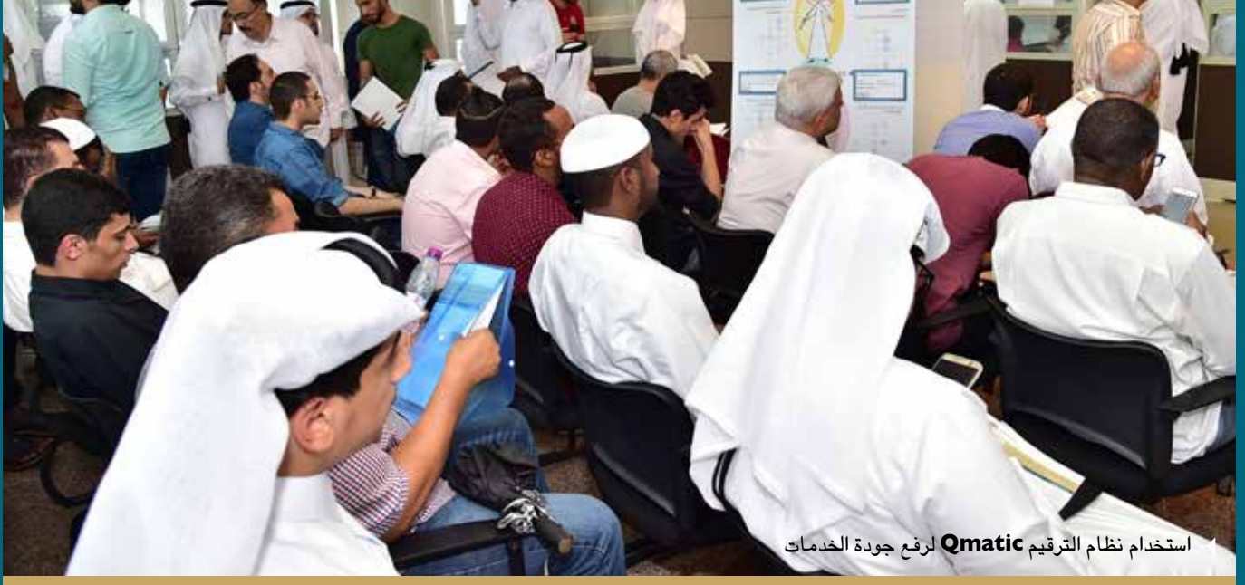
استخدام نظام التقييم Qmatic لرفع جودة الخدمات

شهادة إلى من يهمله الأمر أو أي مستند رسمي آخر يتم إرسال بريد الكتروني لإخطاره بأن الطلب جاهز للاستلام. وأخيراً يسعى القسم إلى تعزيز دور الطالب وتحفيزه على استخدام الخدمات الإلكترونية الذاتية والأنظمة الإلكترونية مع تعزيز تحمله للمسؤولية واتخاذ القرارات بنفسه.