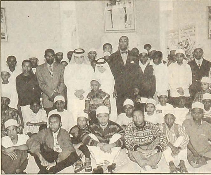
التلاميذ في صورة جماعية