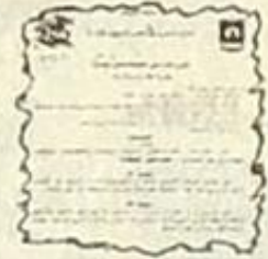
صورة من القرار

لشخص أو يستغلها لغيره رسمياً. وتشير نائب مدير الجامعة الى ان التوقيع على الحضور والانصراف مسكناً غير مشيئة لكن الجامعة تصمم الاكثر من 100 موظفة ويحضر منها العديد من الكليات والادارات والاصناف التابعة للجامعة الامر الذي يحد من التوقيع في اماكن مختلفة من الجامعة. كما يوضح نائب مدير الجامعة ان التوقيع على الحضور والانصراف ليس من اختصاص الادارة بل من اختصاص كل من يتولى العمل في الجامعة. وتقول نائب مدير الجامعة ان التوقيع على الحضور والانصراف ليس من اختصاص الادارة بل من اختصاص كل من يتولى العمل في الجامعة. وتقول نائب مدير الجامعة ان التوقيع على الحضور والانصراف ليس من اختصاص الادارة بل من اختصاص كل من يتولى العمل في الجامعة.