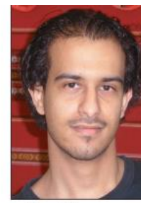
خالد محيي الدين