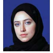
عائلة آل إسحاق