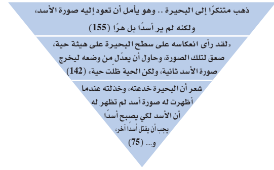
(رسم توضيحي 2)

توزعت نرجسية مختار في «أسطورة الإنسان والبحيرة» بين الشدة والضعف؛ فمثلما تصاعدت حدتها، تدرج ضعفها، ما قاد الأديبة إلى تتبعها وفقا لما تقتضيه من تفاوت في الدرجات بين الذوات، حيث عمدت إلى إيصالها إلى أضعف درجة، محاولة القضاء عليها. إنها تنزل شيئا فشيئا من درجة الأصدية إلى خبث الحية، ثم إلى غرور القطة، بوصفها رموزا قللت من حب الذات عند مختار، بل قادتته إلى الاستياء؛ أي انقلاب الإحساس الهرمي إلى هرمية عكسية، تخالف المنحى التصاعدي للنفسية النرجسية، كما تقود إلى التقهقر في الأحاسيس، الذي يصل إلى حد تنفيه الشخصية والحط من شأنها؛ ما يمكن تمثيله بهذا الشكل: