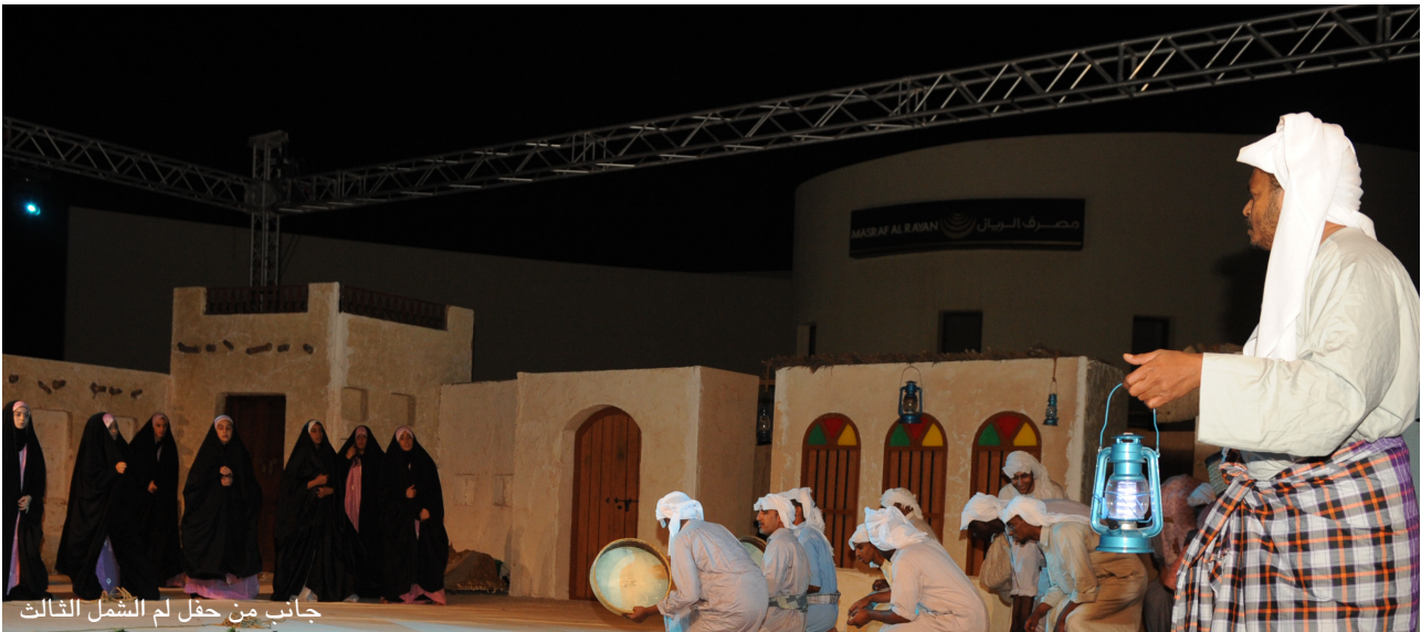
جانب من حفل لم الشمل الثالث