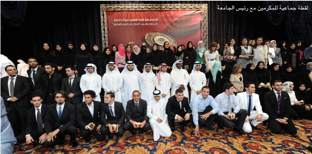
لقطة جماعية للمكرمين مع رئيس الجامعة