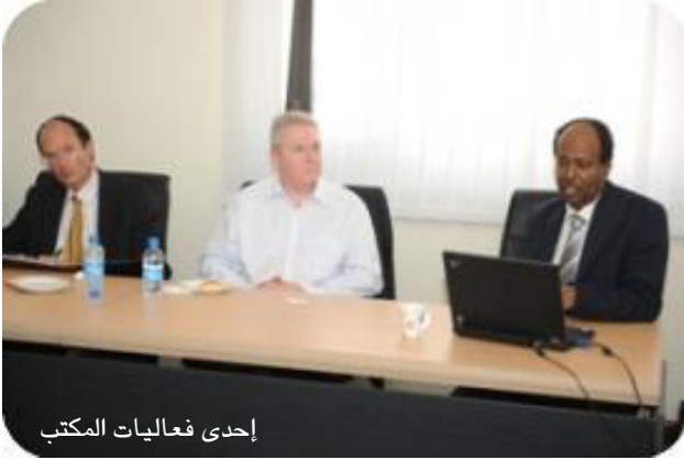
إحدى فعاليات المكتب

وبالمثل، تعاون مكتب التعليم المستمر مع كلية القانون ومكتب (مكثير شامبرز) للمحاماة لطرح أول مساق تدريبي على الإطلاق في التحكيم التجاري الدولي في الدوحة. فخلال مساق استمر لستة أسابيع شارك الطلبة في الأسبوع السادس في مرافعات التحكيم الصورية والتي