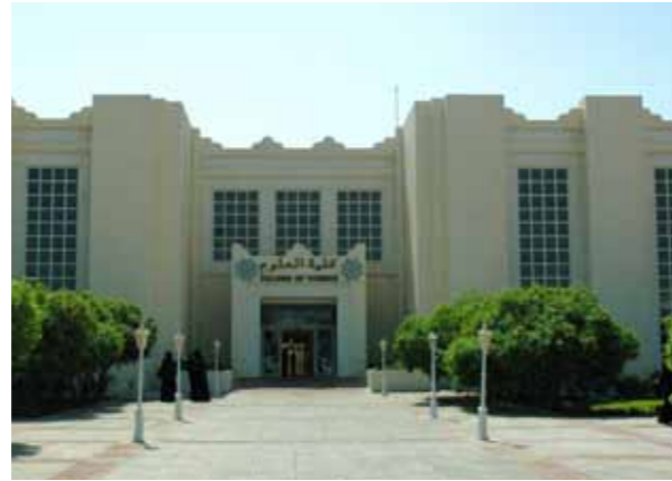
إدارة القبول والتسجيل