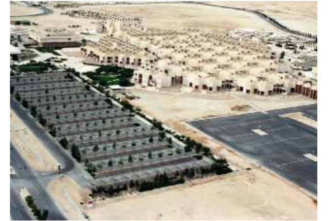
صورة جوية لجامعة قطر ١٩٨٧