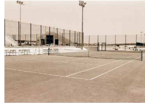
ملاعب جامعة قطر تحت الإنشاء ١٩٨٨