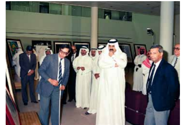
زيارة سموه الشيخ حمد بن خليفة آل الثاني ولي العهد ووزير الدفاع ١٩٨٩