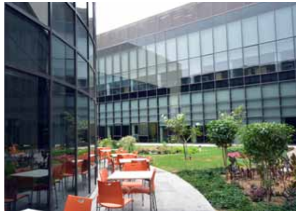
كلية الإدارة والاقتصاد