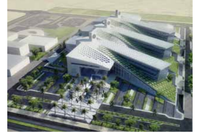
مبني كلية الهندسة