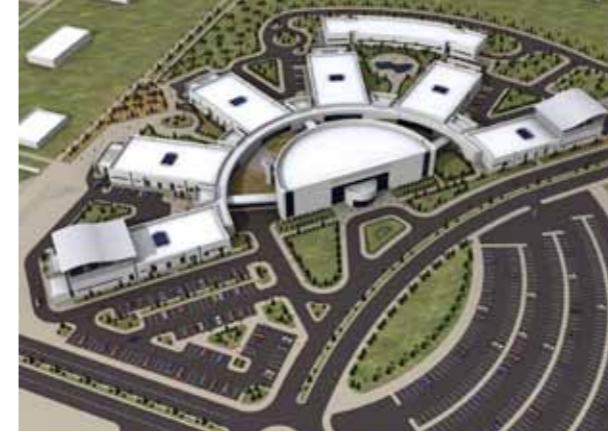
مجمع مركز البحوث