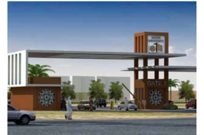
مداخل وبوابات الجامعة

تقدم جامعة قطر أكثر من ٣٠ برنامجاً في الدراسات العليا والتي تمتاز بتنوعها بشكل كبير. وتخطط للمزيد!