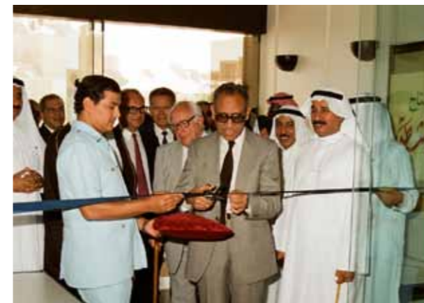
أ.د محمد إبراهيم كاظم - مدير الجامعة يفتتح مبنى النشاط الطلابي بنين - ١٩٨٦