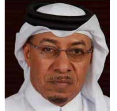
الدكتور سيف الحجري الرئيس