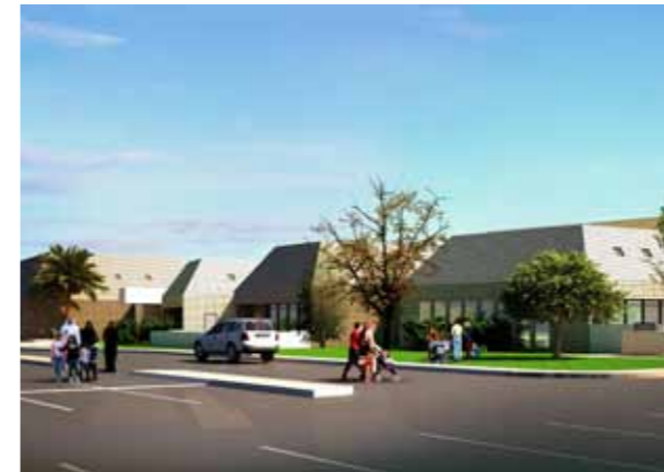
مركز الطفولة المبكرة