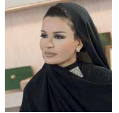
سمو الشيخة موزا بنت ناصر الرئيس الفخري