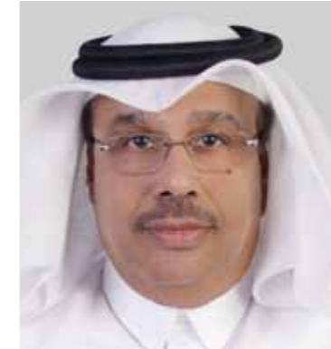
السيد أبوبكر الصيعري نائب الرئيس