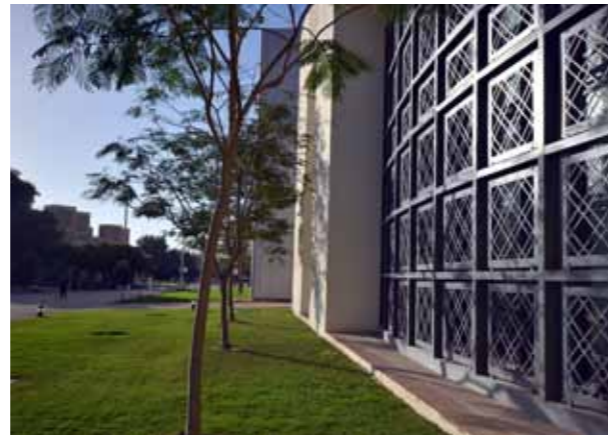
مبنى كلية الهندسة