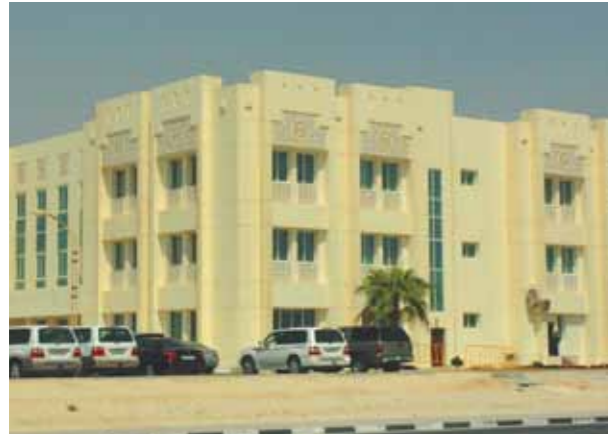
مبنى التأسيسي - بنات