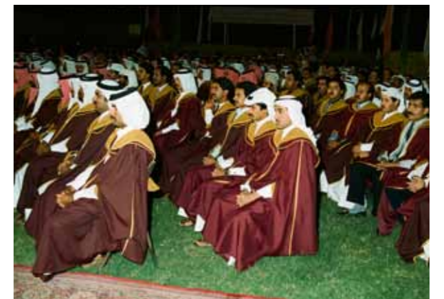
حفل تخريج الدفعة ١٩٨٤