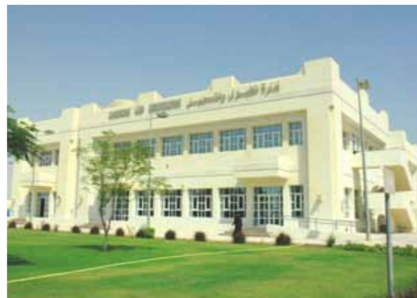
مبنى كلية العلوم