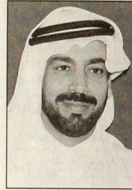
د. محمد علي الكبيسي عميد

التي نحن بصدد الاحتفال بها تعتبر أكبر دفعة من الخريجين والخريجات في تاريخ الجامعة منذ انشائها. لذلك فقد قامت الجامعة باتخاذ الاجراءات الجديدة والتي تتضمن حضور جميع الخريجات لحفل التخرج الا انه تم تقسيمهن الى فئتين: الفئة الاولى سوف تحضر وتشارك في الحفل وتشمل الخريجات ذوات المعدلات الجيد والمقبول والفئة الثانية ستحضر وتشارك وستحظى بشرف مصافحة حرم حضرة صاحب السمو امير البلاد المفدى الرئيس الأعلى للجامعة وهي تشمل ذوات المعدلات الامتياز والجيد جداً.