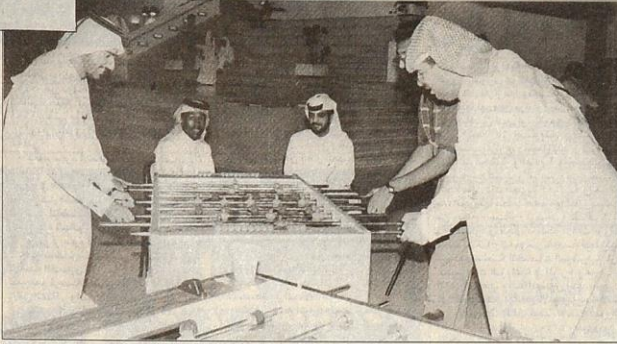
مجموعة من الطلاب يمارسون لعبة الـ بيبى فوت، خلال فترة الراحة ما بين المحاضرات

أما بالنسبة للنشاط الاجتماعي فالمسابقات الثقافية، اخترع معلوماته، بين كليات الجامعة حيث سيمثل كل كلية فريق من أربعة طلاب. مسابقة في المحاضرات والندوات الاجتماعية الهادفة، تنظيم زيارات لبعض المؤسسات العامة مثل يوم المعاق الخليلي، إصدار النشرات والمجلات. تنظيم المسابقات الاجتماعية.. ومنها مسابقة أفضل بحث اجتماعي، وإقامة المعسكر الاجتماعي وطق الخبز.