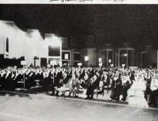
مناظر عام بجانب من الحفل يظهر فيه الضيوف والخريجون