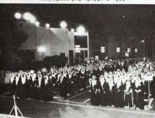
خريجو الدفعة ١٢ يتخذون امكانهم في الحفل