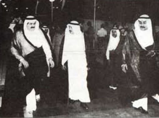
سمو وزير العهد لدى وصوله الى مقر الاحتفال بالجامعة

القي حضرة صاحب السمو الشيخ خليفة بن حمد آل ثاني امير البلاد المفدى الرئيس الال للجامعة قطر مساء امس حفلا في حفل تخريج دفعة الثانية عشرة من طلاب الجامعة قريبا من صحن بسم الله الرحمن الرحيم اصحاب السعادة الشيخ والوزراء السادة الضيوف الكرام ابنتي الخريجين والطلبة بسم الله اعلى التقدير الملتح هذا الحفل التكريم الذي تقيمه جامعة قطر بمناسبة تخريج دفعة الثانية عشرة من ابنتائنا الالارة والطلبة حاضرين على رعاية هذا الاحتفال السنوي منذ انشاء الجامعة قبل ستة عشر عاما تقريبا امي لرسالتها السامية باعتبارها حصن الثقافة ومنازل العلم والحرفا ومعهد الال في تكوين الال الاجيال حضرات السادة