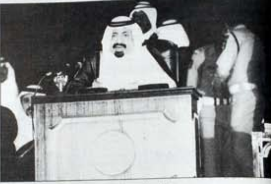
سمو الأمير المفدى يلقى كلمته