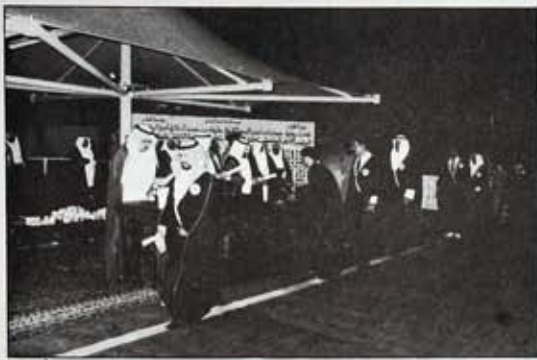
سمو الأمير المفدى يسلم الخريجين الشهادات والجوائز