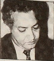
د. علي الدين هلال

المعروف لعلي الخولي والابوين البوسني عبد الله الطيب. أما المحاضرة الأولى فهي كما أسلفنا للدكتور علي الدين هلال وستقام بتفقد شراوتون الودعة يوم الثلاثاء الأول من أكتوبر القادم بقاعة سولي. والدكتور علي الدين هلال يعمل حالياً أستاذاً ومديراً لمركز البحوث والدراسات السياسية بجامعة القاهرة وعضو مجلس إدارة المعهد الدولي للدراسات الاستراتيجية في لندن وعضو مجموعة خبراء الأمم المتحدة حول سياق التسلح وترغ السلاح والتنمية وعضو مجلس تحرير الجلة الدولية لدراسات الشرق الأوسط وعضو مجلس الجمعية الدولية للعلوم السياسية. وقام بالتدريس في جامعة كولومبيا بلسون الجلسون عام ١٩٨٠/٨١ وجامعة برنستون عام ١٩٨١/٨٢ وحصل على وسام العلوم والفنون من الطبقة الأولى. ومن مؤلفات الدكتور علي الدين هلال بالإنجليزية العربية تكوين إسرائيل، وباللغة العربية تكوين إسرائيل، وباللغة العربية تكوين إسرائيل، وباللغة العربية تكوين إسرائيل.