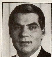
فخامة الرئيس زين العابدين بن علي

قطر لدى الجمهورية التونسية في ان ابرام عشر ثقافتها لتعاون بين البلدين وتطابق وجهات نظرهما حول القضايا السياسية العربية والدولية ويؤكد المستوى المرموق الذي وصلت اليه العلاقات الثنائية ويفتح الافاق لمزيد من التعاون. وقد التقى الرئيس زين العابدين بن علي السفير القطري المصنف الاول من وسام الجمهورية تقديرا لما قام به من عمل وعسا الاوضاع الصادقة والتعاون بين الجمهورية التونسية ودولة قطر.