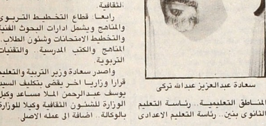
سعادة عبد العزيز بن علي وزير التربية والتعليم

الدوحة - ق ن ا صدر سعادة السيد عبدالعزيز بن علي وزير التربية والتعليم اول امس قرارا وازرا نصت مادته الاولى ان تكون منسوبة الوكلاء المساعدين مثابرة على عدم وزارة التربية والتعليم. وتضمنت المادة الثانية من القرار قطاعات الوزارة الرئيسية على العهدة والارشاد. قطاع الشؤون السلكية والارادية. قطاع الشؤون الادارية وشؤون الموظفين. قصاصات التواريات. القطيات. المباني المدرسية. الخدمات والتشؤون العامة. المحافظات. قسم التفتحية. قسم الزراعة. تانسا. قطاع الشؤون التعليمية. شؤون ادارات التربية الاجتاعية. التربية الرياضية تعليم البنات. وزراء.