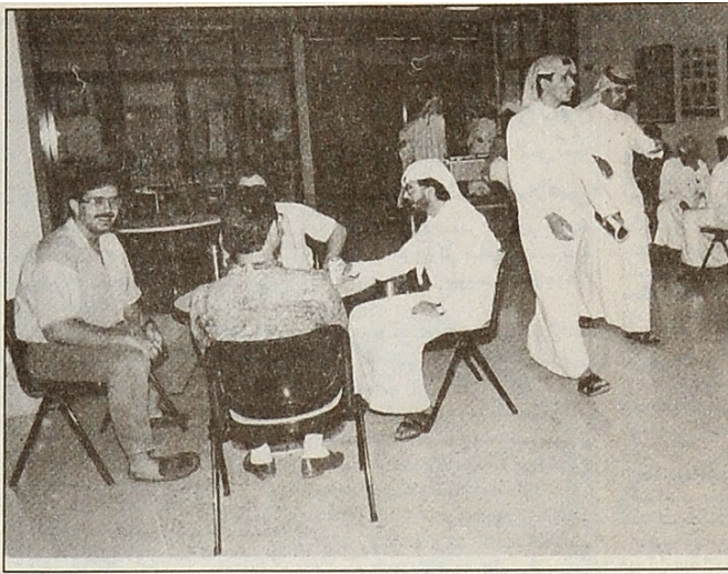
مجموعة من الطلاب داخل مبنى الأنشطة الطلابية