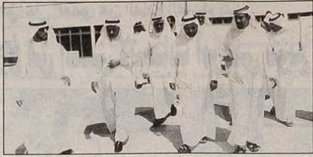
الوزير وفجاءات الجامعة وزيارة لجمع الرياضات المائية

التي توفقت خلال الاجتماع تمهيدا لخصريتها على اجتماع قادم بين الطرفين في ديسمبر المقبل للبدء في تنفيذها. وأضاف الوزير انه تمت الموافقة خلال الاجتماع على اشراك الوزارة في تطوير بعض المجالات التي تتشعب عنها مجالات التنسيق الاخرى في شتى العلوم والموضوعات والقطاعات التي توفقت خلال الاجتماع تمهيدا لخصريتها على اجتماع قادم بين الطرفين في ديسمبر المقبل للبدء في تنفيذها.