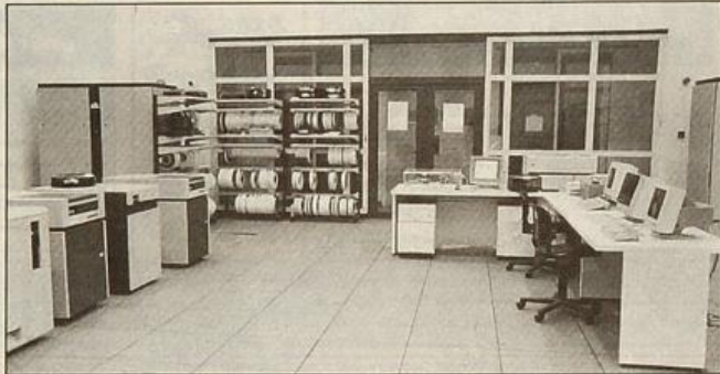
أحد أقسام مركز الحاسب الآلي

وأضاف: كما يحتوي مبنى مركز الحاسب الآلي بالبيتين على 3 أنظمة للحاسبات الرئيسية مخصصة للنظم الإدارية ونظام معلومات المكتبات، والأبحاث التي تتطلب أجهزة ذات قدرات عالية، ويحتوي المركز على المعمل الأكاديمي الذي تم تخصيصه لأعضاء هيئة التدريس والباحثين ويضم عددا من أجهزة الماكنتوش والحاسبات الشخصية ومحطات العمل المتصلة بالجهاز الرئيسي ويوفر بالمعمل طابعات الليزر والطابعات المسوطة والمساحات الضوئية وتحتوي هذه الأجهزة معظم البرامج المستخدمة في الجامعة مثل برامج معالجة النصوص «عربي - إنجليزي» وقواعد البيانات، ويحتوي أيضا على معمل للتدريب خصص للدورات التدريبية حيث جيز بعدد من أجهزة الحاسبات الشخصية والطابعات النقطية وطابعات الليزر. وأضاف: ويضم مبنى أخصر للحاسب الآلي في مبنى البعثات ويشمل على معمل للتدريب الرئيسي لتدريس المقررات ومعمل للتدريب والمعمل الأكاديمي.