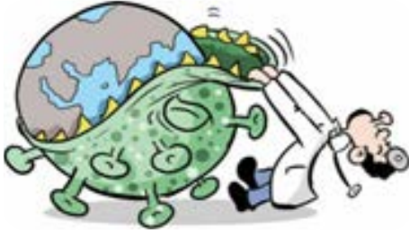
الرسم الكاريكاتيري (12)