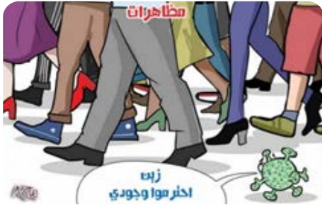
الرسم الكاريكاتيري (13)