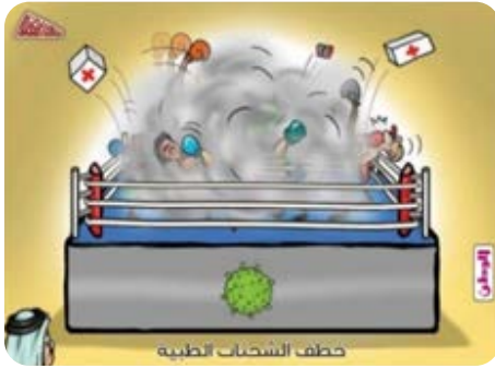
الرسم الكاريكاتيري (42)

الشرعية، ومهاجرون أوروبيون يُطردون من القارة الأفريقية؛ نظرًا إلى انتشار الوباء في بلدانهم. ولا شك في أن التركيز على البحر له مؤداه في الصورة من حيث هو سبيل الهجرة غير الشرعية، فهو يذهب بقراءات متعددة عند المتلقي ليذكر بمآسي أولئك المهاجرين الأفارقة وما يتعرضون له من