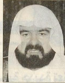
د. علي محيي الدين القره داغي