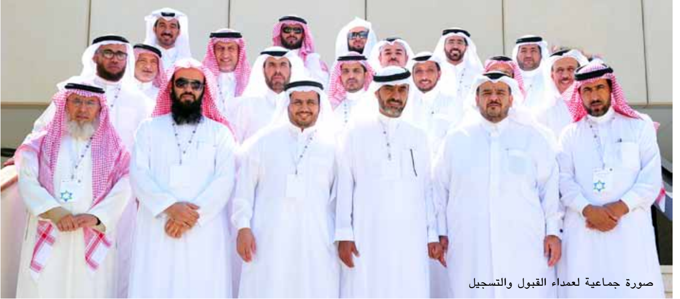
صورة جماعية لعمداء القبول والتسجيل

جازان، الخليج العربي، جامعة الإمام محمد بن سعود الإسلامية، جامعة الملك سعود، جامعة البحرين، جامعة الاميرة نورة بنت عبدالرحمن، جامعة القصيم، جامعة الملك خالد، جامعة السلطان قابوس، جامعة الملك فيصل، جامعة تبوك، جامعة سلمان بن عبدالعزيز، جامعة الحدود الشمالية، جامعة الجوف، جامعة الملك فهد للبترول والمعادن، جامعة المجمعة، جامعة نجران، جامعة الدمام، جامعة الباحة، جامعة حائل، جامعة الملك عبد العزيز، الجامعة الإسلامية، جامعة القصيم.