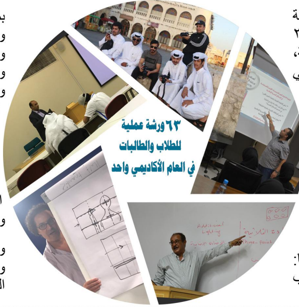
٦٣ ورشة عملية للطلاب والطالبات في العام الأكاديمي واحد

وغطت الورشات موضوعات عدة من بينها: كيفية كتابة بلاغ احترافي بهدف مد الطلاب