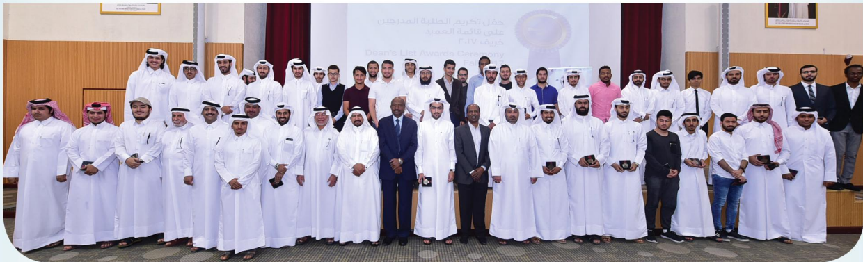
صورة من اسماء طلاب قسم الاعلام المندرجين في قائمة العميد