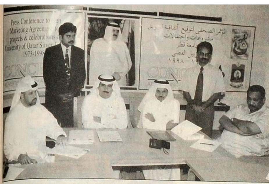
أثناء توقيع العقد