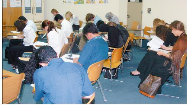
جانب من أداء امتحان تحديد المستوى