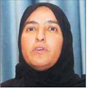
أ. د. شيخة بنت جبر