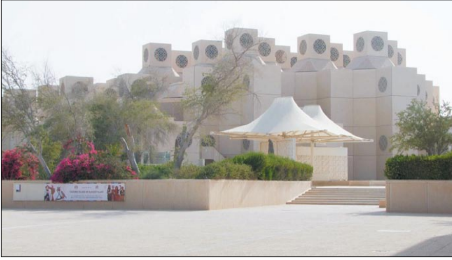
مبنى جامعة قطر