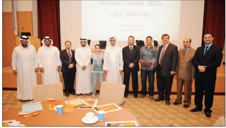
صورة جماعية للفائزين بالمسابقة في نسختها الثانية 2009