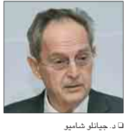
د جيانلو شاميو

كما تتميز جامعتنا بورها الريادي في القطاع البحثي، ويعد خمس سنوات فقط من تأسيس الجامعة، على تأسيس عدد من الشركات بناء على الابتكارات التي قمنا بإنتاجها، وحالياً، نقوم بإجراء العديد من المحرم في مجالات الطاقة والنظ والتشويق الاقتصادي وغيرها وقد قام أعضاء هيئة التدريس وطلبة الجامعة باختيار العديد من المجالات، ويجب أن تكون جامعة الملك عبدالله، التي تأسست بهدف التحدي والتميز والفرص، وأن يحدث تغييرات في المجتمع وبناء الاقتصاد القائم على المعرفة، كما تحدث د. جيانلو شاميو في حضور الجامعات الأخرى في المنطقة وقال: «أرى أن الاستمرار في قطاع البحوث ما زال يفتقر إلى المنفعة مقارنة بالدول الأخرى، إلا أن قطر والجامعة ومصر في حقلها تقدمنا نموفاً نشيراً هماً إجابات مفيدة في مجال علمية كحكمة». وأضاف جيانلو شاميو إلى أن معدل الالتحاق على البحوث في مختلف الشرق الأوسط وشمال أفريقيا قد تضاعف في السنوات العشر الأخيرة إلا أنه يتخلف على الجامعات ببلد مزدهم من الجهود لتحقيق التقدم في المجال البحثي.