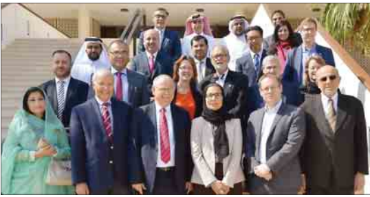
رؤساء الجامعات في صورة جماعية

أكد عدد من رؤساء الجامعات المشاركين في قمة التميز للتعليم العالي لجامعة منطقة الشرق الأوسط وشمال أفريقيا لـ «الشرق»، أهمية إقامة هذا الحدث في جامعة قطر. وقال د. جيانلو شاميو رئيس جامعة أمانة عبدالله العلوم والتقنية في المملكة العربية السعودية: «يعتبر هذا المنقبي فرصة هامة للحديث عن إدارة الجامعات وقدراتها مع التركيز على العلوم والتكنولوجيا ودورها». وأضاف في جامعة الملك عبدالله، لا تحاول أن تكون جامعة كبيرة وضخمة وإنما تركز بشكل كبير على طرر برامج تعليم متميزة في المنطقة. وقد بدأنا بالفعل بمناسفة العديد من الجامعات في هذا المجال.