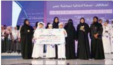
إثناء تكريم طلاب مدرسة حطين النموذجية