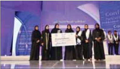
إثناء تكريم مدرسة الإيمان الثانوية