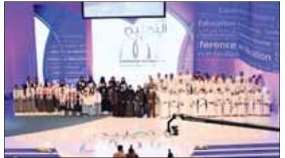
إثناء تكريم جامعة للمكرمين بمؤتمر التعليم

سيكون مشرفاً لقد حرصت كلية التربية خلال السنوات السابقة على التعاون مع هيئة التعليم لتكثيف مؤتمرات سنوي في البحث العلمي واستمر على مدى أربع سنوات متتالية، ولإبراز أعضاء الهيئة المهنية بشكل كامل في تقديم أبحاثهم الفعالة والمعلمين وتقديم الدعم والمشورة الفنية في هذا المجال، ويتكاتفون مع العمدة من البرامج التربوية التي تساعد المعلمين على اكتساب مهارات البحث وتمكينهم من المساعدة طلبة في إعداد مشاريعهم البحثية، واختُصت عمدة كلية التربية كلتمها بتأكيدوا على دور الشراكة بين المجلس الأعلى للتعليم وهيئة التربية من أجل الشراكة الوظيفية التي تربط الكلية مع طلبة المجلس والدراسات العليا التي تم تطويرها وتقديمها لتلبية احتياجات القطاع التعليمي على مدى السنوات السابقة منذ تأسيس الكلية إلى اليوم، تشكل نموذجاً مشرفاً لتكامل جهود القطاعات ذات العلاقة لتحقيق هدف واحد، إلا وهو الارتقاء بمهيمته التعليم وتعلم الطلبة في دولة قطر.