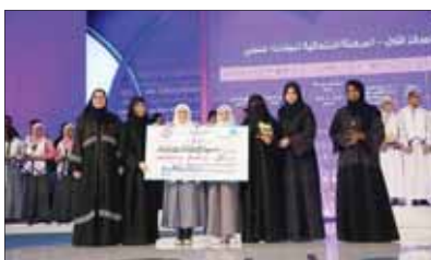
إثناء تكريم مدرسة سمية في مؤتمر التعليم

استراتيجية لتطوير مهارات البحث العلمي في مدارس التعليم العام والخاص