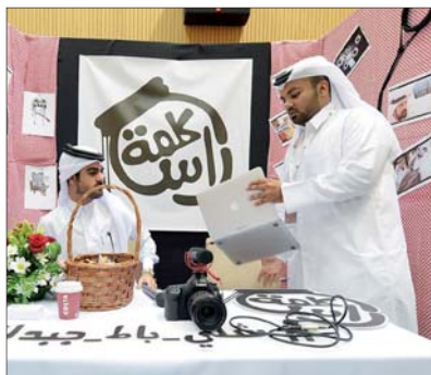
ت طالبان في احد اجنحة المعرض

وإضافة التمثيل والإعلام الجديد للمرة الأولى