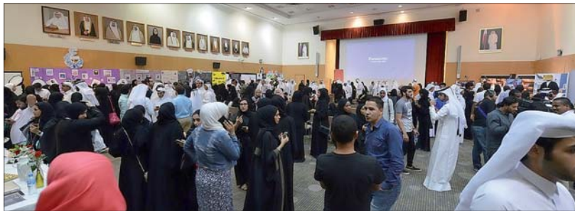
ت حضور طلابي كبير