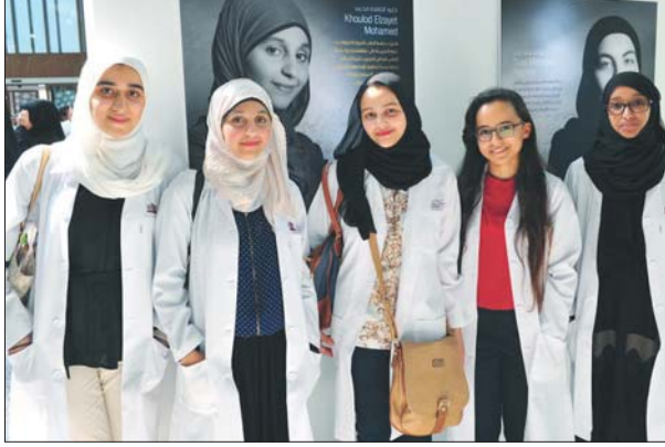
تعداد من طالبات كلية الطب

بداية حدثنا عن مسيرتك في مجال الطب والتعليم الطبي؟ تخصصت في جراحة الأطفال في أميركا ولغريبول ثم في الولايات المتحدة الأمريكية بجامعة ميريلاند. ثم تخصصت أيضاً في مجال التعليم الطبي وحصلت على الدكتوراه في هذا التخصص من جامعة غروينغن بهولندا وهي من أشهر الجامعات الأوروبية في مجال التعليم الطبي. قمت خلال مسيرتي العلمية الأكاديمية بالمساهمة في إنشاء ثلاث كليات طب في جامعة الشارقة، جامعة الخليج العربي وجامعة قناة السويس. عملت نائباً لمدبر جامعة الشارقة للكليات الطبية والصحية وعميداً لكلية الطب وقبول ذلك عميداً لكلية طب جامعة الخليج العربي واعتز بأن عدد من طلابي القديرين هم اليوم استشاريون في كافة التخصصات الطبية في قطر وحالياً أشرف بان اسمي في إنشاء صرح طبي جديد بجامعة قطر وهو كلية الطب أملا أن أسخر خبراتي في مجال التعليم الطبي للوصول بها إلى أرقى المستويات العلمية.