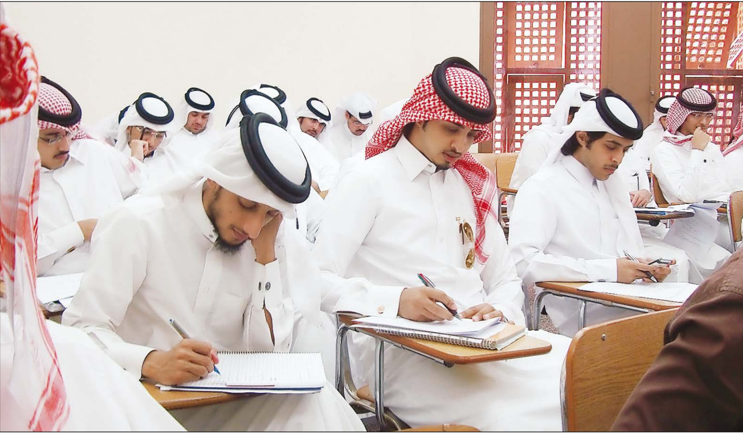
جانب من طلاب كلية الإدارة والاقتصاد

ولا يمكن احتساب المقررات الدراسية في التخصص الأساسي أو الفرعي للطلاب كمتطلبات لبرنامج المتطلبات العامة بالإضافة إلى أنه لا يمكن احتساب أكثر من 3 مقررات دراسية (9 ساعات مكتسبة) من أي برنامج تخصص لتعويض استيفاء متطلبات برنامج المتطلبات العامة.