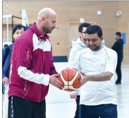
رئيس الجامعة يشارك في لعبة كرة السلة

فعاليات اليوم الرياضي للدولة للعام 2020 يشارك جهاز التخطيط والإحصاء بالعلوم في جامعة قطر وقطر الخيرية في فعاليات هذا اليوم وذلك إدراكاً من الجهاز بأهمية تعزيز الالتزام الوطني في مجال التنمية البشرية. إحدى الركائز الأربع لرؤية قطر الوطنية 2030 - والتي تهدف إلى تطوير وتنمية سكان دولة قطر لكي يتمتعوا من بناء مجتمع مزدهر، كما أعد الرياضة أحد القطاعات الأساسية التي تقوم عليها استراتيجيتي التنمية الوطنية الثمانية 2018-2022 التي تبنت مشاريع واسعة وتحفل بها هذا القطاع، ولا شك أن تنظيم الاحتفال باليوم الرياضي لجميع الفئات العمرية هو ضرورة نحو بناء جسور التواصل بين كافة فئات المجتمع وإعداد جيل سليم والكفاءة بالوظائف الفكرية والعقلية وكلها تضمن في عجلة التنمية البشرية. ومن جهته قال الدكتور خالد الخنجي نائب رئيس جامعة قطر للشؤون الطلاب إن اهتمام جامعة قطر بالاحتفال باليوم الرياضي يأتي في إطار إيمان الجامعة بأهمية الرياضة ودورها في بناء الإنسان، وتشجيع المجتمع الأكاديمي ومنتسبها جامعة قطر على