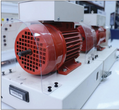
من التجهيزات في الكلية

حاليا حوالي 200 طالب وطالبة في قسم الهندسة الكهربائية بغالبية للبنين على البنات.