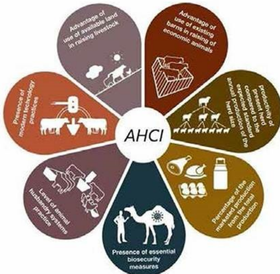
Animal Holding Classification Index - AHCI

نشر ورقة بحثية: ممارسات الثروة الحيوانية: تصنيف الحيازات الحيوانية التقليدية في قطر ٢٠٢٠ نحو أمن غذائي مستدام