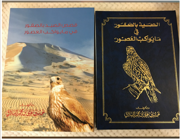
□ مؤلفات البادي

من واقع الخبرة نصيحتي للشباب الصقارين وكذلك الجيل القادم بأنه إذا وجد «طيراً» ضائعاً أن يقوم برده إلى صاحبه لأنه فيه شريحة ورقم تلفون صاحبه وهذه أمانة وأصعب حاجة أن تأخذ طير غيرك ، لا يجوز من ناحية شرعية وكذلك أخلاقية ، ومعروف لدى أهل قطر إذا صدت الطير عليك أن ترده لصاحبه حاول الاتصال والبحث عن صاحبه الطرق .