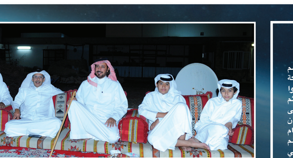
□ في مجلسه مع الاهدل