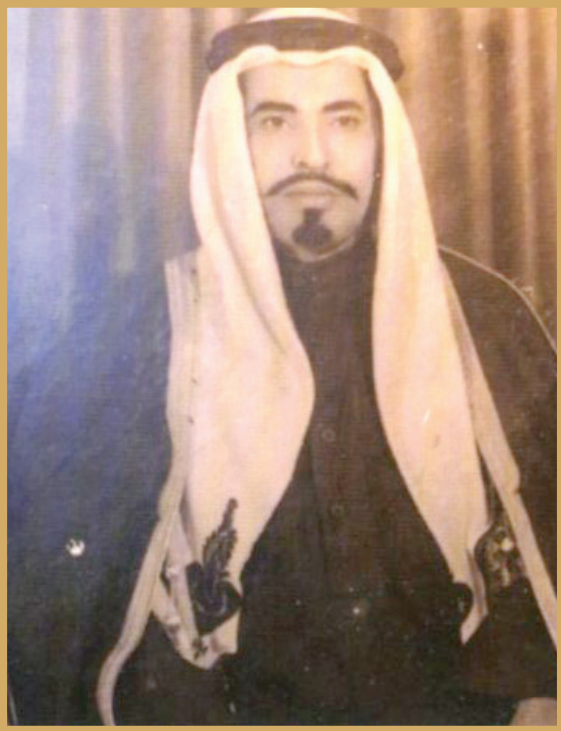
□ الوالد رحمه الله