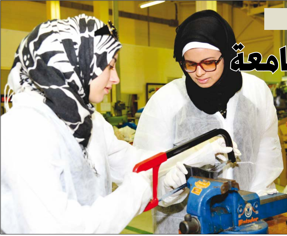
□ تدريب عملي بأحدث المعدات

وتسعى جامعة قطر من خلال مكتب إدارة الجودة ومكتب نائب رئيس الجامعة المشارك لشؤون المرافق وتكنولوجيا المعلومات إلى الحفاظ على استدامة واستحداث أعلى معايير الجودة في كل نطاق الحرم الجامعي بما يتماشى مع المتطلبات الوطنية والعالمية.