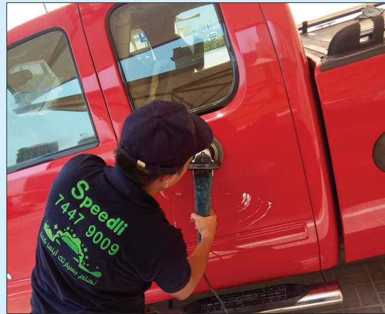
□ تقديم خدمات صديقة للبيئة

ومن خلال الحجز الإلكتروني الذي يتميز بالسهولة، يمكن للجمهور البحث في مجموعة كبيرة ومتنوعة من خدمات الغسل وحجز أي خدمة متوفرة خلال ثوان معدودة، وذلك عن طريق محرك يمكن المستخدمين من معرفة كافة المعلومات المتعلقة بالخدمات المتوفرة، كما يزودهم بالصور، ويشترك معهم تجارب العملاء السابقين الذين يمكنهم من خلالها رصد وتتبع مدى جودة الخدمة المقدمة عبر التطبيق، حيث يتم عرض جميع المعلومات من صور وتعليقات للعملاء حول الأسعار والخصومات وغير ذلك. وبعد أن يقوم المستخدم باختيار الخدمة والوقت الذي يناسبه، وتحديد موقع المكان عبر خرائط جوجل أو بإدخال عنوان المكان (البيت والشارع والمنطقة)، يقوم التطبيق بإرسال طلب الحجز إلى الشركة المقدمة لخدمة الغسل والتي بدورها تتواصل مع العميل لتأكيد الطلب.