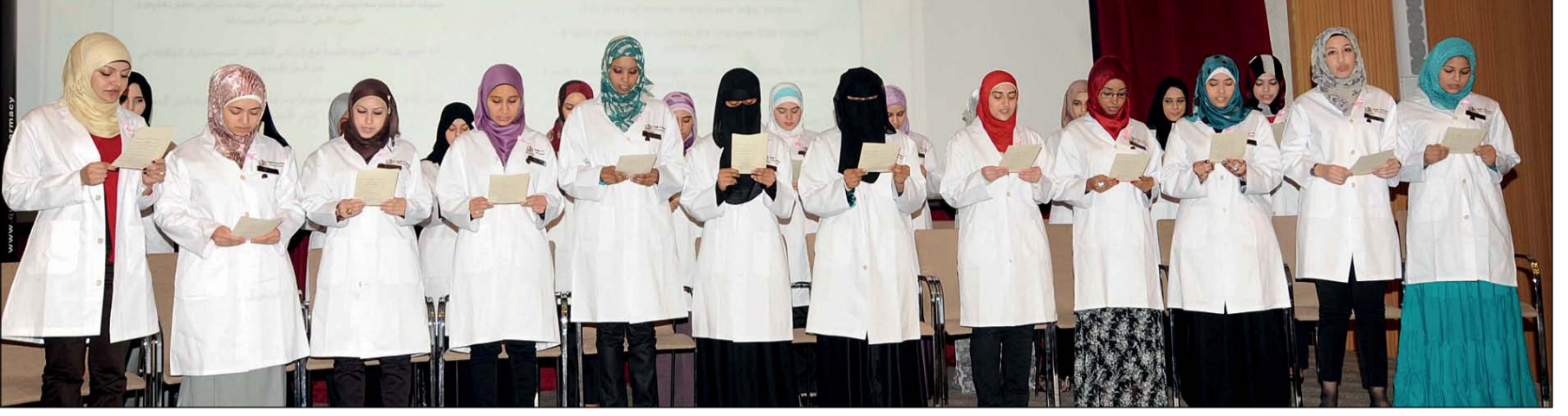
□ الطالبات يؤدين القسم

المنطقة، اتفاقية للتدريب الإكلينيكي، حيث سيتم ضمها بموجب هذه الاتفاقية كشريك في برنامج التدريب التجريبي لطالبات الصيدلة في سلسلة الصيدليات التابعة لها.