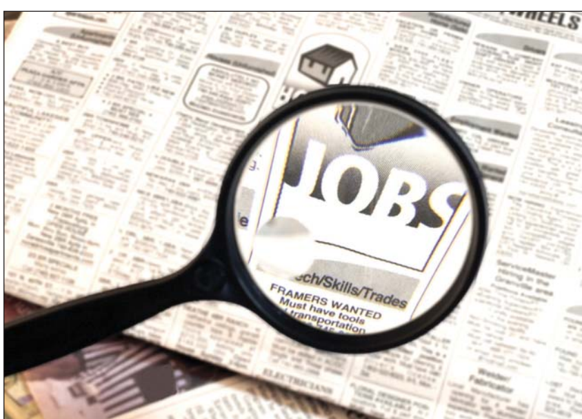
هل البحث عن وظيفة سيكون أمراً سهلاً؟