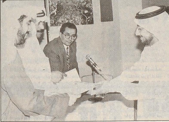
مدير الجامعة لدى تسليمه الشهادات للخريجين في الدورة