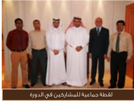
لقطة جماعية للمشاركين في الدورة

وضمن خطة زمنية معينة. وقد أشاد المشاركون بمستوى وأهمية الدورة والتي تساعدهم على التحكم وإدارة التخطيط والتطوير المؤسسي على مختلف المستويات الإدارية وذلك باستخدام نظام للمقاييس يساهم في تنظيم ومتابعة الإستراتيجية وتطوير الفاعلية فيها وفق معايير الأداء المتزن.