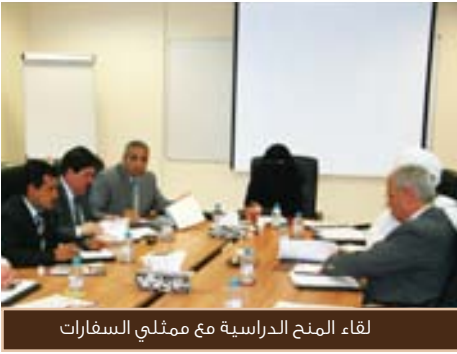
لقاء المنح الدراسية مع ممثلي السفارات

والمنح. وعرض ومناقشة متطلبات القبول والمستندات المطلوبة للالتحاق بالدراسة في الجامعة. كما أشارت بعض الملحقيات إلى بعض صعوبات التواصل والتنسيق مع القسم بشأن منح دولها. وتوصلوا لوضع عدد من المقترحات التي من شأنها تجاوز الصعوبات المذكورة وتسهيل التواصل بين القسم والجهات المعنية. وفي نهاية اللقاء، قام السادة ممثلي السفارات بتعبئة نموذج التواصل مع قسم المنح الدراسية والذي يسهل عملية التواصل معهم وتزويدهم بالمعلومات الضرورية عن طلبتهم في الجامعة.