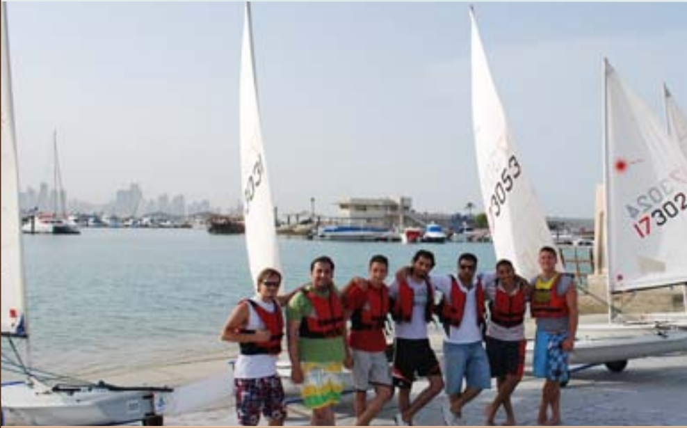
لقطة جماعية للطلبة المشاركون في الدورة

ومن حيث المستوى التدريبي للمشاركين. فقد تمكن العديد منهم من قيادة قوارب شراعية بمفردهم، وبزيادة الجرعات التدريبية سعى القائمون