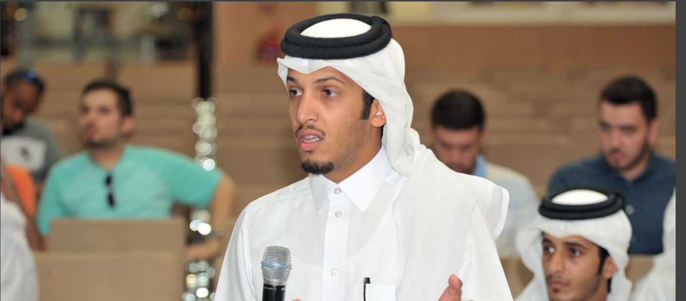
جانب من تفاعل الطلبة في اللقاء

وقد حضر اللقاء الكثير من طلبة الجامعة والذين طرحوا مختلف الأسئلة والتعليقات على رئيس الجامعة وتركزت حول الخدمات الطلابية مثل الكافتريات، والمواقف، والمقررات الدراسية، والمناهج، وسوق العمل بعد التخرج . وفي كلمته بالمناسبة أكد الدكتور حسن الدرهم رئيس الجامعة أن الهدف من هذا اللقاء هو إتاحة الفرصة لجميع الطلبة