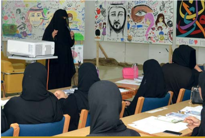
جانب من الحضور في الورشة

يأتي موضوع الصحة النفسية كأحد أهم الجوانب التي تهتم بها جامعة قطر، وتحثل به سنويا لتوعية طلبتها وموظفيها وأعضاء هيئة التدريس فيها، ويأتي هذا الحدث السنوي في كل عام بحلة متجددة، ويأتي حاملا معه الكثير من المعلومات القيمة، لتثري