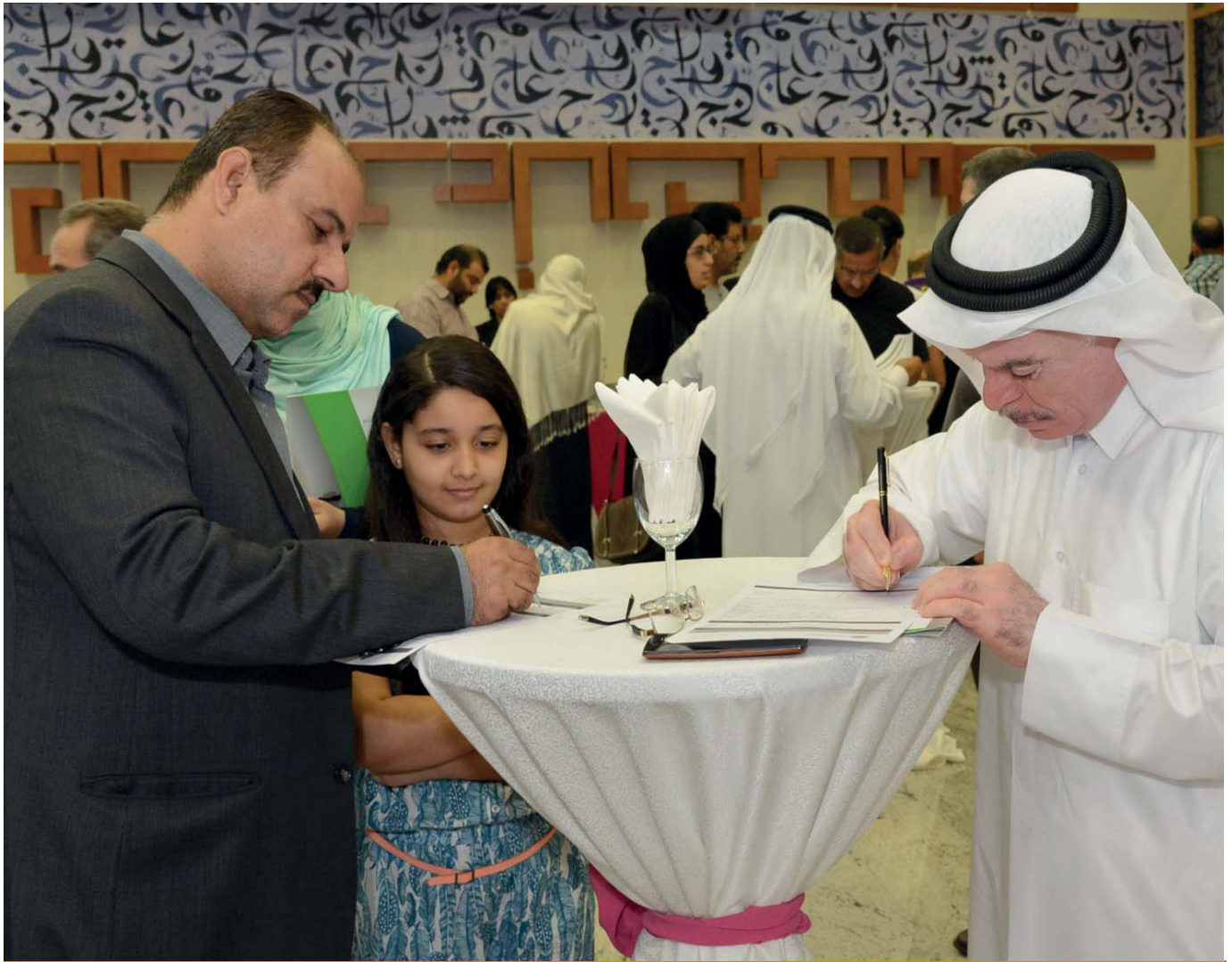
حضور لافت لأولياء أمور الطلبة الجدد في اللقاء التعريفي