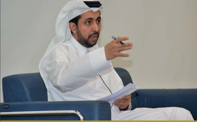
الدكتور حسن الدرهم

الطالب هو محور العملية التعليمية ونبض الجامعة الحي، وسنركز على خدمة الطالب الطلبة مدعوون للمشاركة في اللجان المختلفة بالأقسام الأكاديمية والكليات