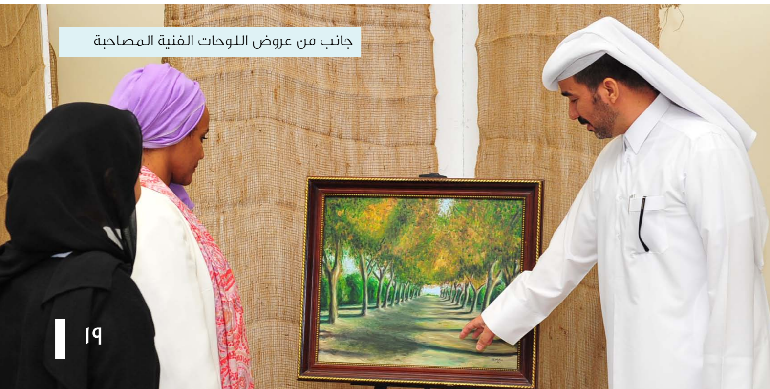
جانب من عروض اللوحات الفنية المصاحبة