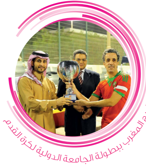
تتويج المغرب ببطولة الجامعة الدولية لكرة القدم