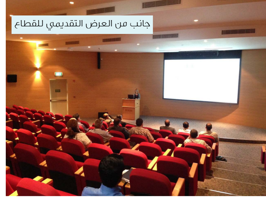
جانب من العرض التقديمي للقطاع

وأضاف: «بالرغم من الكم الكبير للمعلومات في العرض والمرتبطة بالأنشطة المختلفة للقطاع إلا أنه تم تعريفنا بصفقتنا أكاديميين بمختلف