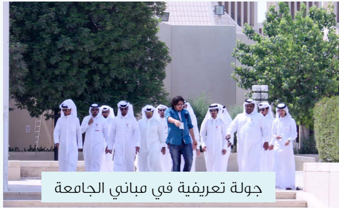
جولة تعريفية في مباني الجامعة

قام قسم التواصل مع الطلبة بتقديم خدمة «اكتشف جامعة قطر» خلال أيام اللقاء التعريفي للطلبة الجدد. وذلك بتوفير جولات في الحرم الجامعي لحوالي ٢٨٠٥ من الطلبة الجدد (٢٢٧ طالب، ٢٠٧٨ طالبة) وذلك من خلال ٤٦ جولة خلال الثلاثة أيام للقاء التعريفي للبنين، و ١٠٦ جولة خلال الأربعة أيام للقاء التعريفي للبنات.