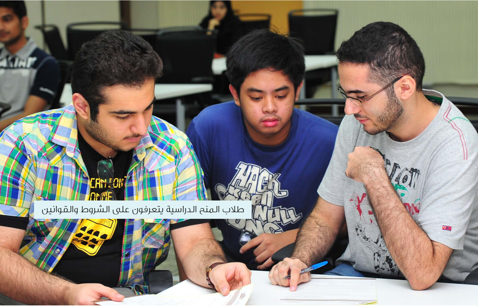
طلاب المنح الدراسية يتعرفون على الشروط والقوانين

من هذه المنح تمنح على أساس الجدارة والمنافسة الأكاديمية، فإن الجامعة تقدم أيضاً منحاً دراسية على أساس الحاجة، وتغطي هذه المنح تكاليف الرسوم الدراسية، وتمتد مزايا بعضها لتشمل واحدة أو أكثر من المزايا الأخرى ومنها الإقامة المجانية في الإسكان الجامعي، والتنقل من الجامعة إليها، بالإضافة إلى تذكرة سفر سنوية إلى بلد الطالب الأصلي ممن لا يقيمون في قطر، علماً بأن الطالب يتحمل الغرامات المالية كافة والمترتبة على حذف المقررات الدراسية أو الانسحاب من الفصول الدراسية.