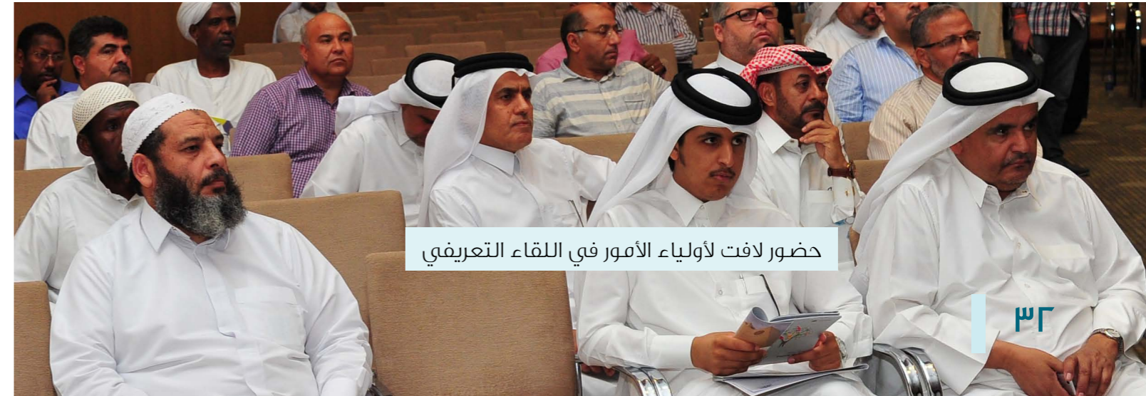
حضور لافت لأولياء الأمور في اللقاء التعريفي

ذلك، قام القسم أيضاً بالمشاركة باللقاء التعريفي لأولياء الأمور، وذلك بتوفير ١٣ جولة لأولياء أمور الطلبة المهتمين بالتعرف على مباني الحرم الجامعي والخدمات المقدمة والذين بلغ عددهم ٤٨. وقد تم تصميم برنامج مختلف للجولة الخاصة بأولياء الأمور ليشمل مباني الحرم الجامعي بشكل عام، والمعلومات التي تهم أولياء الأمور. بالإضافة إلى التركيز على المباني التي تحتوي على خدمات موفرة لأولياء الأمور مثل مجمع الرياضات المائية والمكتبة.