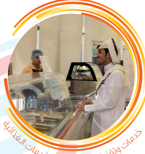
خدمات وتقنيات حديثة في الخدمات الغذائية