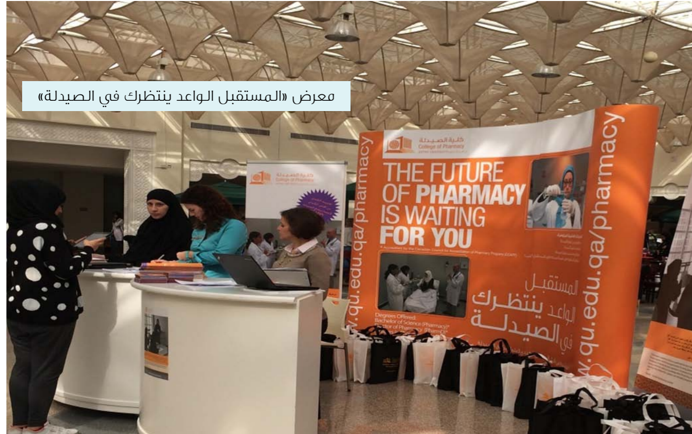
معرض «المستقبل الواعد ينتظرك في الصيدلة»

أعلن قسم الخدمات العامة للطلاب بجامعة قطر عن عدد من الخدمات الجديدة والمبتكرة والتي ستدشن قريباً في الجامعة ومنها آله تجريبه لبيع القرطاسية في مبنى للطلاب البنين. وخدمة الطباعة والتصوير الذاتي باستخدام بطاقة الطالب الجامعية في عدد من المباني والكليات بالإضافة الى تفعيل قاعات الانترنت وذلك عن طريق عقد ورش تدريبية للطلبة. كما أدخل قسم الخدمات العامة للطلاب عدداً من التحسينات على الخدمات الحالية لطلبة الجامعة والتي تساهم في إثراء وتوفير الدعم اللازم. وقام القسم بإتاحة الفرصة للطلبات من مختلف التخصصات للتسجيل في خدمة الخزائن في مبنى كلية العلوم ومبنى البنات الرئيسي، حيث جاءت هذه الخطوة استجابة للتزايد الكبير على طلب الخزائن في هذه المباني والتي كانت مخصصة فقط لطلبات من تخصصات محددة فقط. كما قام القسم بتفعيل منصات التواصل الاجتماعي ونشر العديد من الإعلانات والرسائل على هذه المواقع من أجل تعريف الطلاب الجدد والقادمي على الخدمات التي يقدمها القسم وطرق التواصل المختلفة للاستفادة من تلك الخدمات.