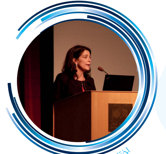
اختتام مشروع بادر التطوعي