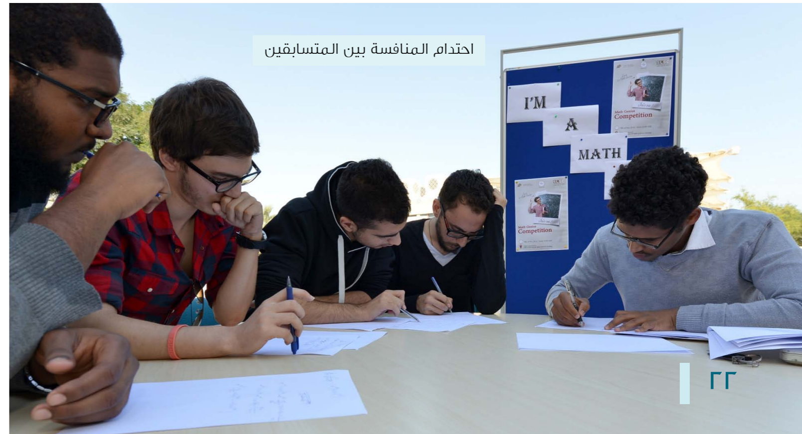
احتدام المنافسة بين المتسابقين

وذكر السيد أنور الترك، منسق التوظيف الطلابي عن شروط وفترة الترشح لهذه الجائزة، موضحاً بأنه يجب على الطلبة الذين يرغبون بالترشح استيفاء جميع شروط الجائزة ومنها: