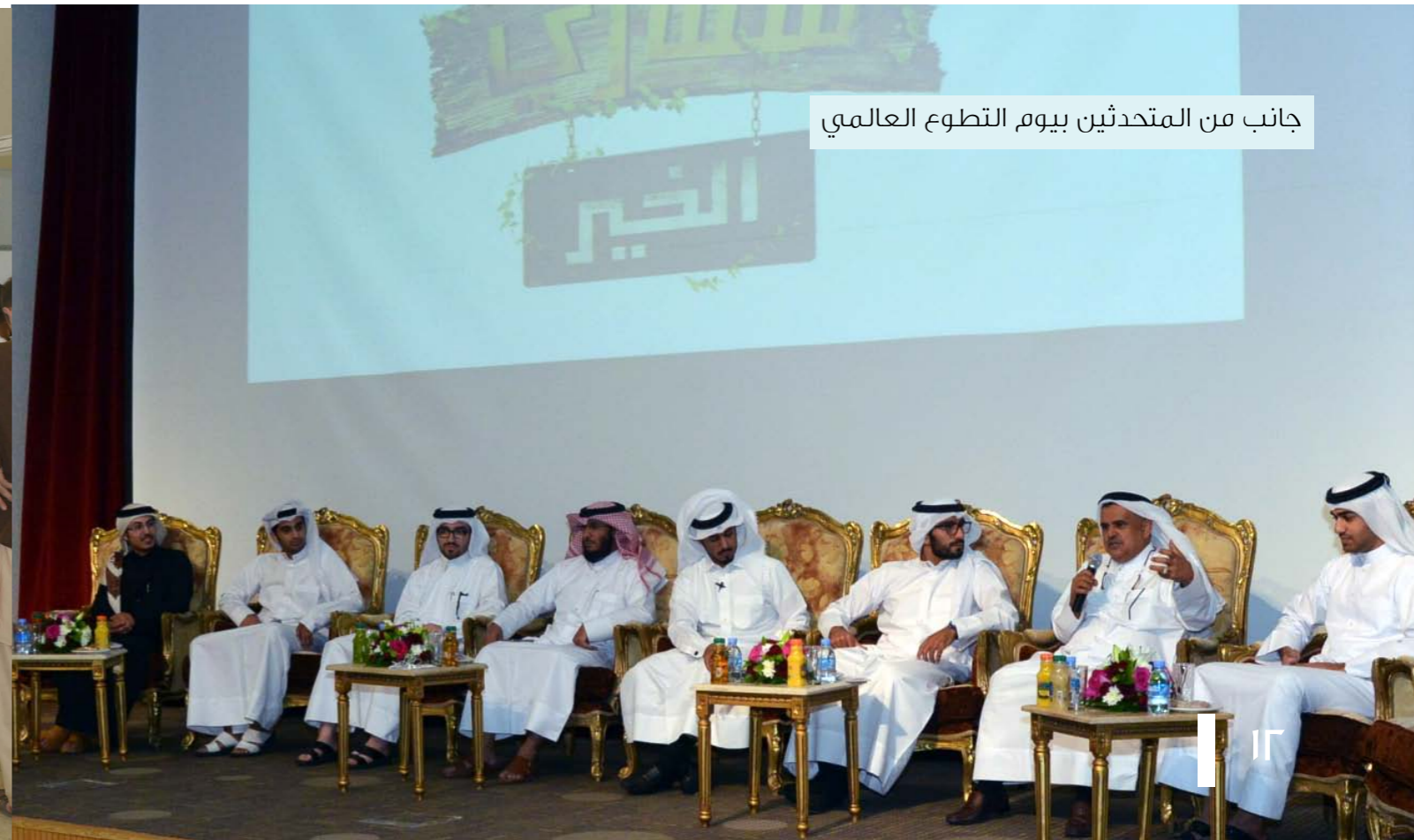
جانب من المتحدثين بيوم التطوع العالمي