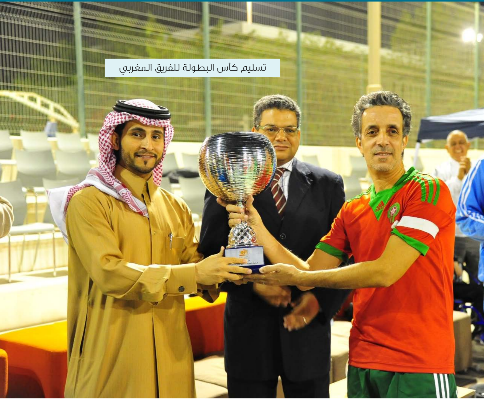
تسليم كأس البطولة للفريق المغربي