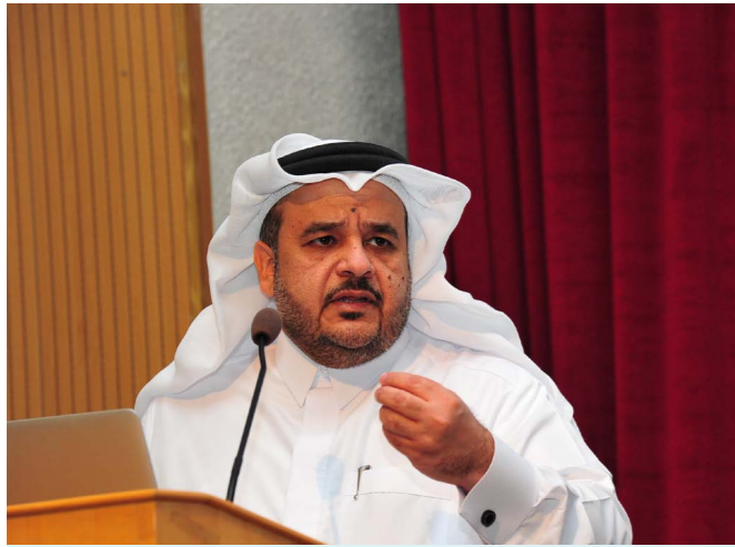
د. عمر الأنصاري يلقي كلمة الافتتاح

أكد الدكتور عمر الأنصاري نائب رئيس الجامعة لشؤون الطلاب على أهمية الدور الذي يلعبه القطاع في تعزيز ودعم العملية التعليمية، مشيراً إلى أن له دوراً مهماً وجوهرياً لا يستقيم سير العملية التعليمية بدونها، وذلك للعدد الكبير من الخدمات والمهام التي يقوم بها القطاع سواء ما يتعلق منها بالجانب الأكاديمي أو الخدمات والأنشطة الطلابية، والتي تصب كلها في هدف واحد وهو دعم العملية التعليمية وإعداد خريجين مؤهلين لسوق العمل.