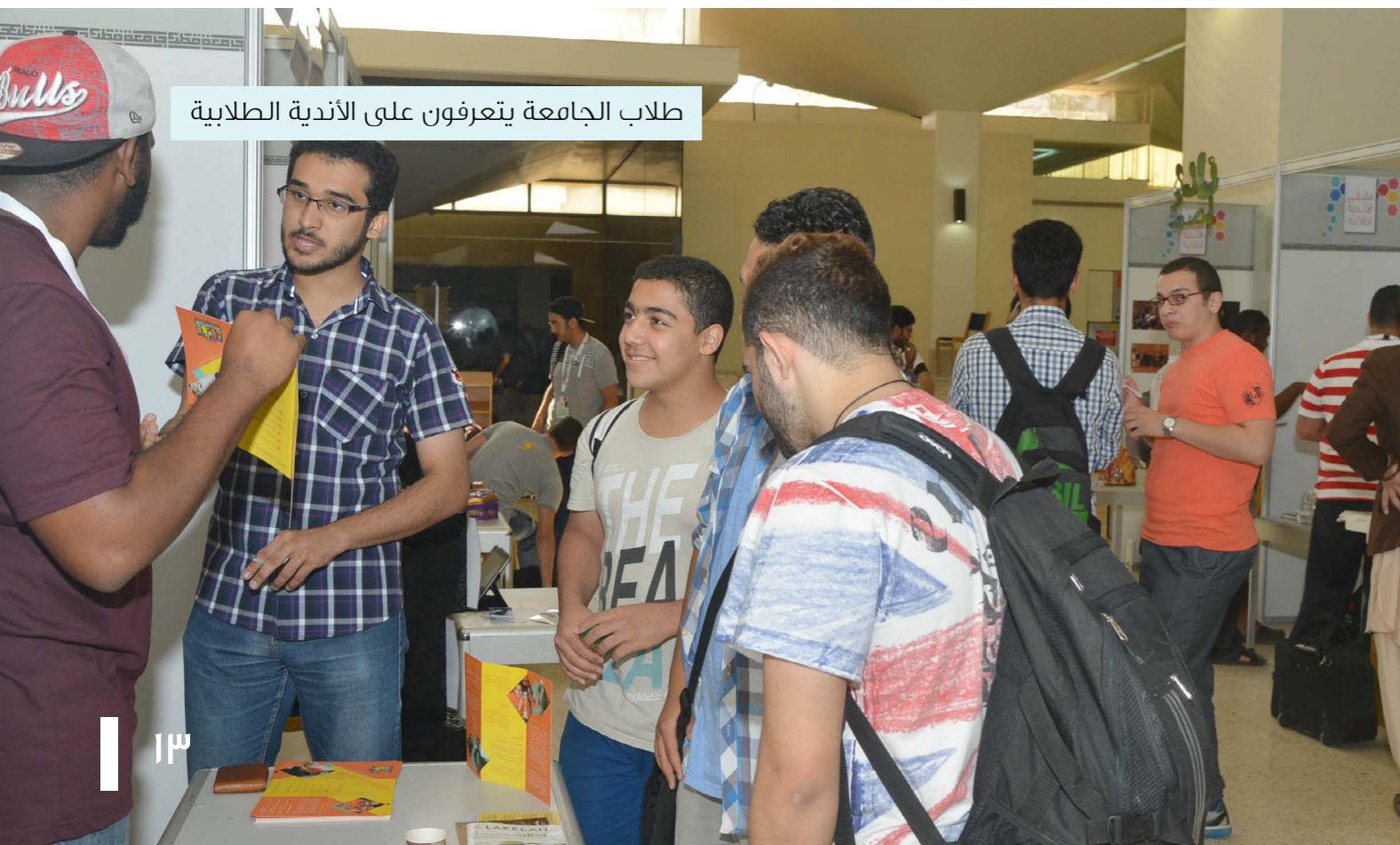
طلاب الجامعة يتعرفون على الأندية الطلابية