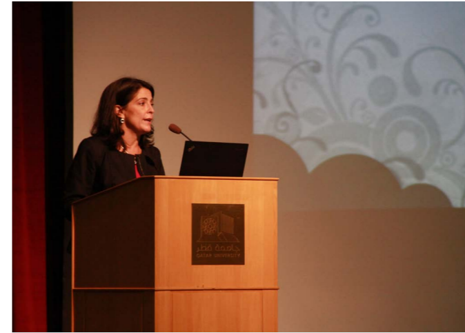
السفيرة الأمريكية تلقي كلمتها في الحفل الختامي

اختتمت في جامعة قطر فعاليات مشروع «بادر» التطوعي، والذي يشرف عليه كل من مركز التطوع والخدمة المجتمعية، ومبادرة الشراكة الأمريكية الشرق أوسطية.