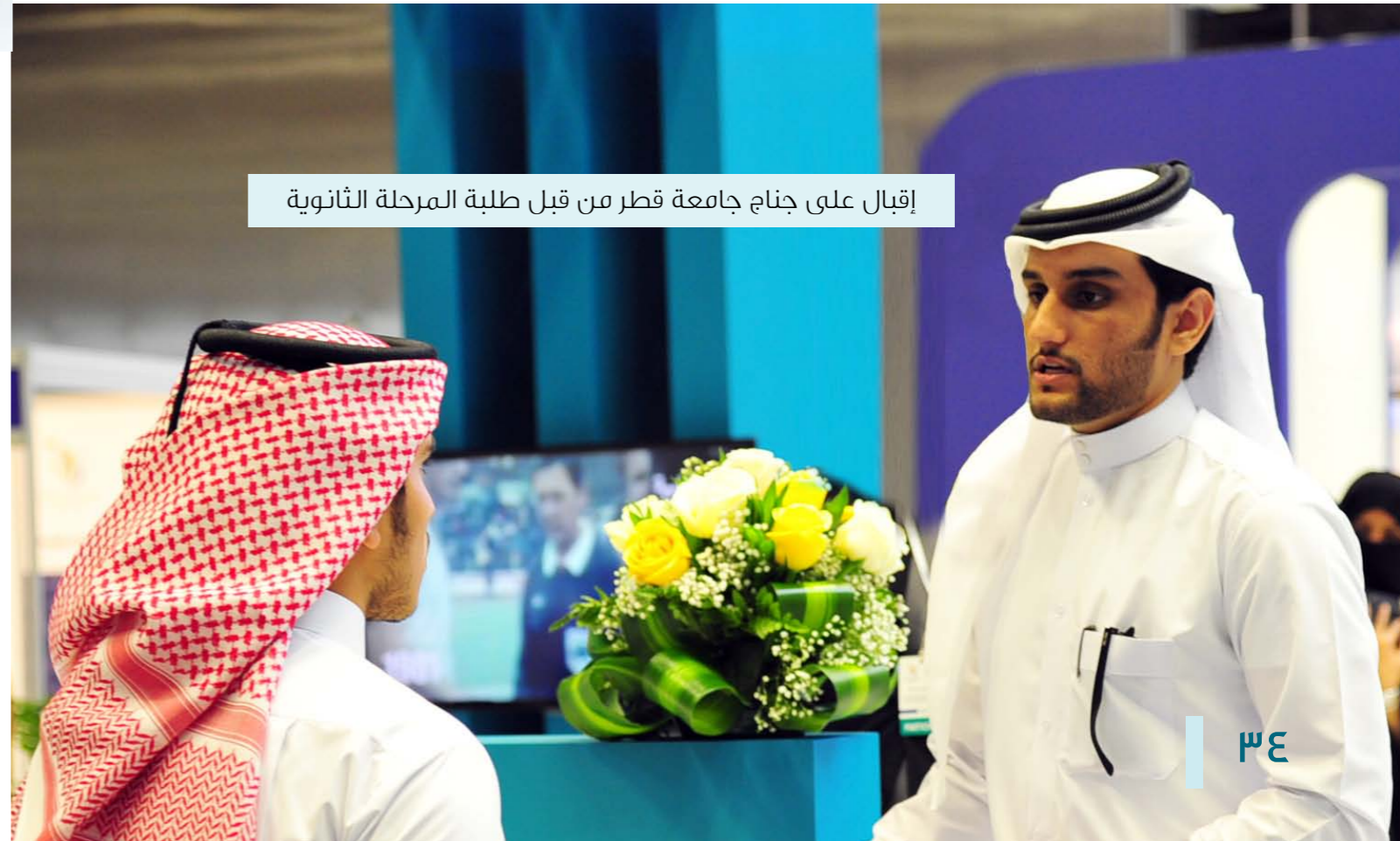
إقبال على جناح جامعة قطر من قبل طلبة المرحلة الثانوية

وشارك في المعرض أكثر من ٨٠ جامعة وكلية من الجامعات المدرجة على قوائم المجلس الأعلى للتعليم، بما في ذلك جامعة قطر وجامعات المدينة التعليمية، والجامعات البريطانية والأسترالية