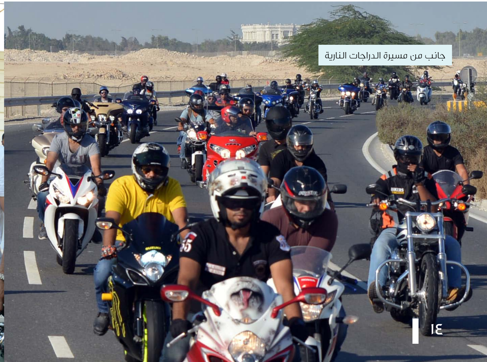
جانب من مسيرة الدراجات النارية