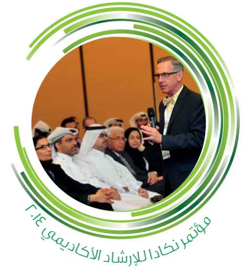
مؤتمر نكاد للإرشاد الأكاديمي ٢٠١٤