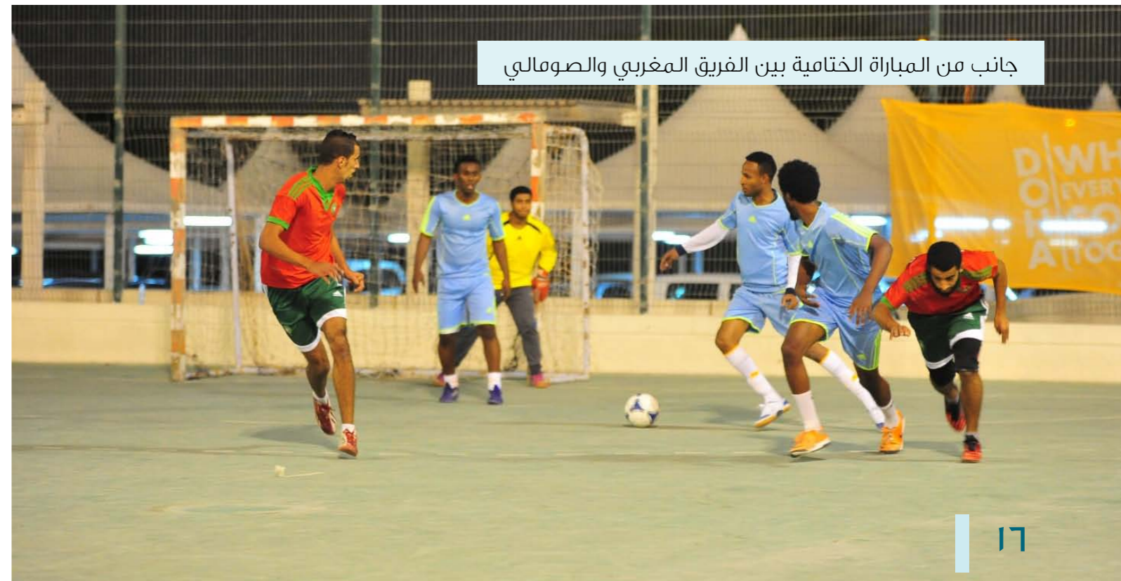
جانب من المباراة الختامية بين الفريق المغربي والصومالي