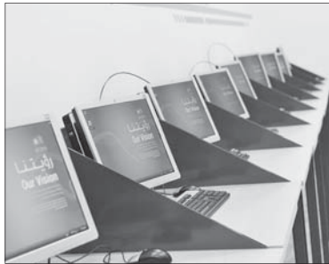
▷ بيئة تقنية متطورة في مكتبة جامعة قطر