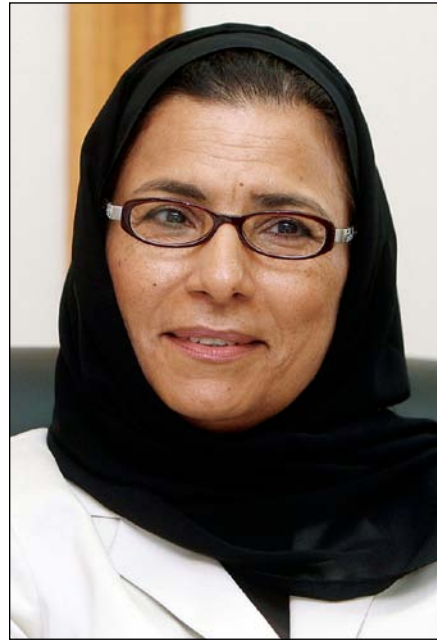
□ الدكتورة شيخة المسند