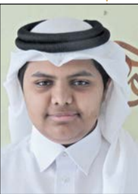
□ جبر المناعي

وأشار إلى أن الكثير من الطلاب يلتحقون بالقسم الأدبي، نظراً لرغبتهم في التأهل للكلية العسكرية.